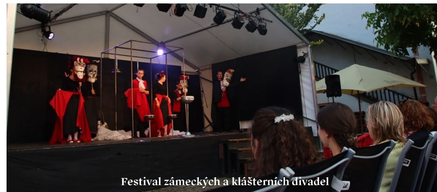
Festival zámeckých a klášterních divadel

Jubilejní 20. divadelní sezona začala pražskou premiérou inscenace Raut 29. 9. v Divadle VILA Štvanice. Navzdory posunu téměř o rok se podařilo inscenaci pod vedením hostujícího režiséra Matiji Solceho nazkoušet